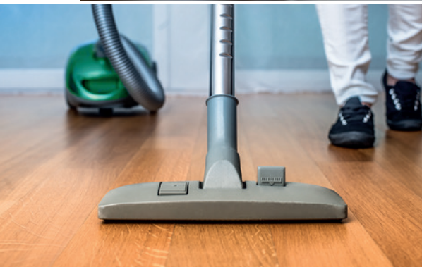
Auf Wunsch verfügbare Dienstleistungen bieten Komfort.