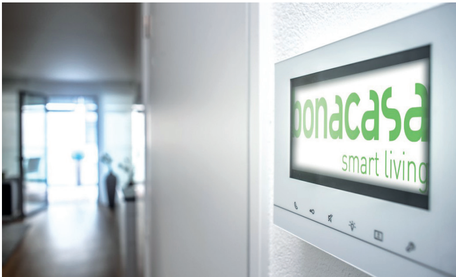
Die digital vernetzten Wohnungen bieten Sicherheits- und Komfortfunktionen.