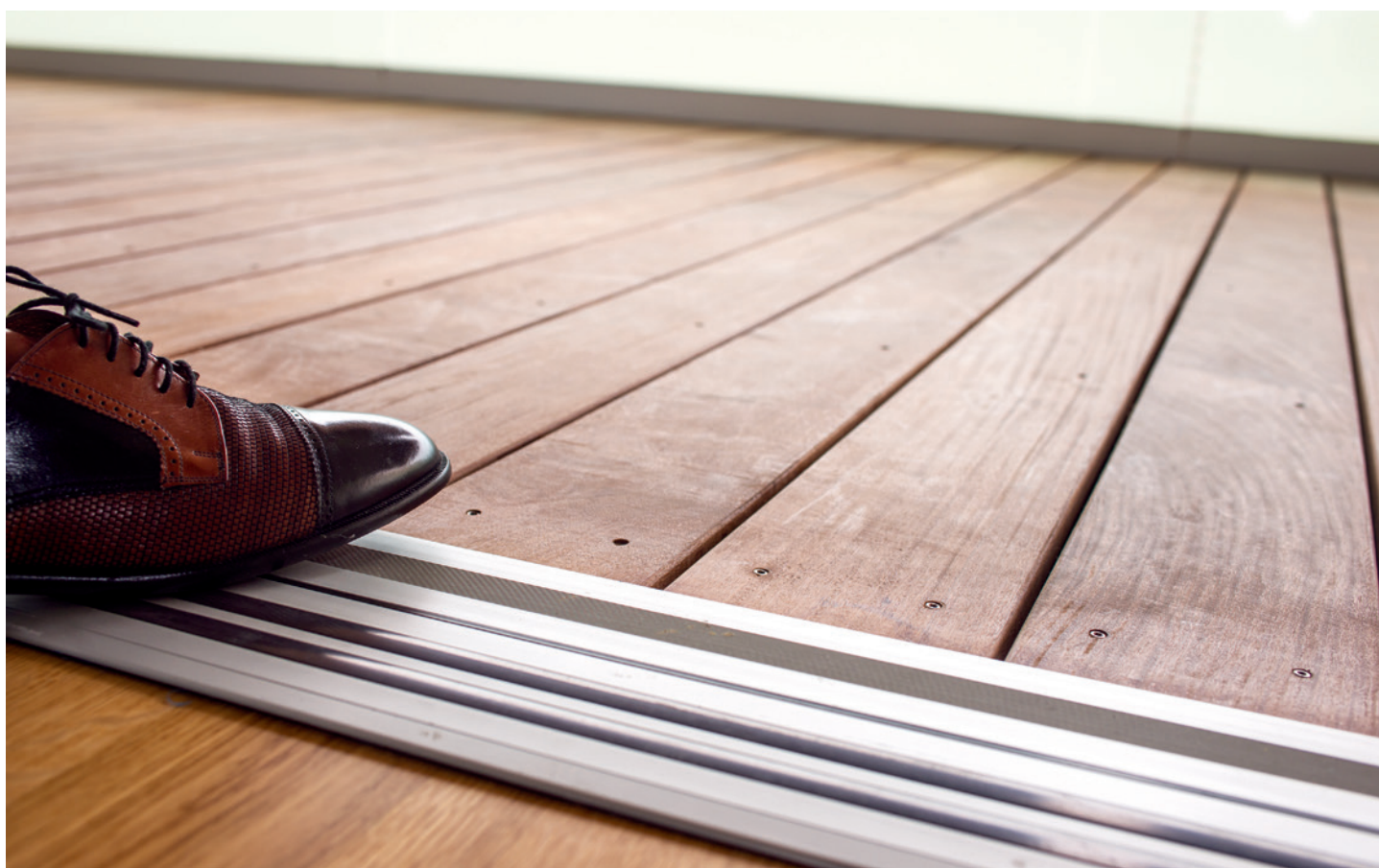
bonacasa-Wohnungen sind durchgängig schwellenfrei.

Text: Philipp Dreyer, Alain Benz