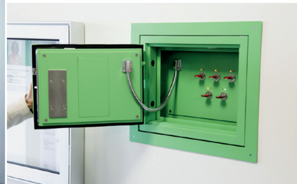
Der Schlüsseltresor und der Notrufservice versprechen 24/7-Sicherheit.