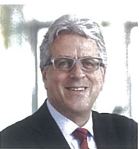
Christoph Caviezel Mobimo Holding AG

(rh) Christoph Caviezel, CEO chez Mobimo depuis octobre 2008, a permis aux actionnaires de bénéficier de rendements avantageux. Le cours de l'action a augmenté d'environ 55% depuis son entrée en fonction. En 2017, la société immobilière a à nouveau enregistré un excellent résultat avec un bénéfice de 91,5 millions de francs. Mobimo développe ses activités en réalisant d'importants projets dans le quartier d'Aeschbach tout comme à Mattenhof, Labitzke