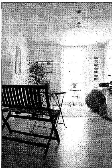
Hell und freundlich, so macht

Auf dem Areal Belle Air Spital Ost sind in acht Mehrfamilienhäuser 54 3 1 / 2 - bis 5 1 / 2 -Zimmer-Wohnungen (Fr. 440 000–870 000) käuflich (IBP, Thun). Im Neufeld entstehen 42 2 1 / 2 - bis 5 1 / 2 -Zimmer-Mietwohnungen (Ammann Globalbau, Hilterfingen). Im Obstgarten Thun Süd werden zwölf 5 1 / 2 -Zimmer-Einfamilienhäuser gebaut (IBP Thun). In Thierachern sind in der