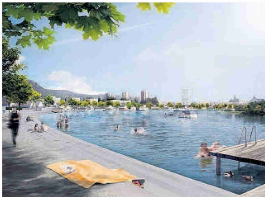
Mediterranes Flair im Mittelland: die Wasserstadt Solothurn. VISUALISIERUNG HERZOG & DE MEURON

Nur zehn Minuten vom Zentrum soll das neue Quartier entstehen. Pläne und erste Eindrücke im Video.