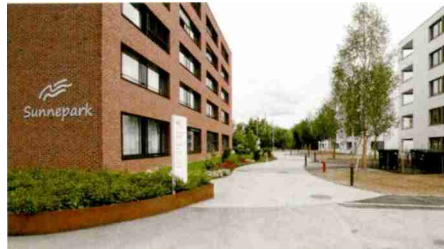
Überbauung Sunnepark, Egerkingen/SO

natlich CHF 40 steht sie zur Verfügung für verschiedene Kommissionen oder die Organisation von Arbeiten und Diensten aller Art. Bestandteil des Konzepts ist eine App, über welche man Bedürfnisse anmelden und sich auf kurze Reaktionszeiten verlassen kann. In Egerkingen sind die Dienstleistungen vorrangig auf Menschen in der zweiten Lebenshälfte zugeschnitten. Beim Notrufdienst wird der Betrieb des Alters- und Pflegezentrums miteinbezogen. Entscheidet sich die jeder-