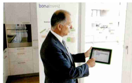
Der Kontakt zu den Betreuungsleistungen erfolgt per Telefon, Notrufsender oder via App.

Das Angebot der Concierge ist Teil des Bonacasa-Konzepts, das die Bonainvest AG, Erbauerin und Besitzerin des Sunnepark, entwickelt hat und deren Segnungen sie verschiedenen Wohn- und Ferienanlagen im eigenen wie auch in fremdem Besitz angedeihen lässt. Die oder der Concierge darf nicht mit dem herkömmlichen Abwart verwechselt werden. Die Dienstleistung mit dem französischen Namen betreut nach Wunsch individuelle Wohnungen und die Menschen, die in