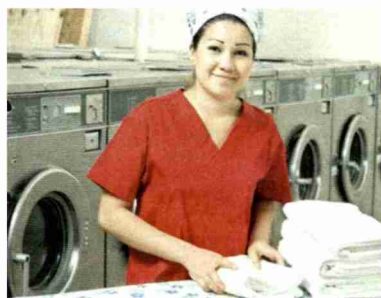
Une jambe cassée, un agenda surchargé? Il est possible de faire blanchir son linge dans les immeubles abritant des logements avec services.

Ce succès a sans surprise poussé d'autres concierges à monter leur petite société, notamment dans le canton de Neuchâtel. Désormais, les acteurs de la branche sont même fédérés via l'Association suisse des concierges personnels (ASCP). PMI