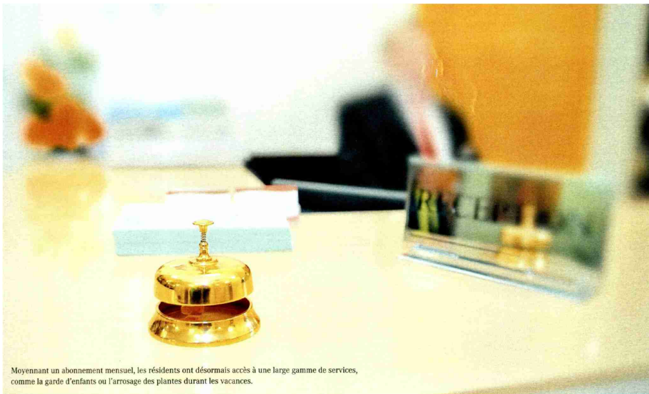
Moyennant un abonnement mensuel, les résidents ont désormais accès à une large gamme de services, comme la garde d'enfants ou l'arrosage des plantes durant les vacances.

Themen-Nr.: 818.006 Abo-Nr.: 1088641 Seite: 10 Fläche: 67'666 mm 2