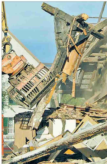
Wertvolles Stück in der Schwebе: Der mächtige Wandständer des Brunnerhauses wird durch die Kantonsarchäologie konserviert.