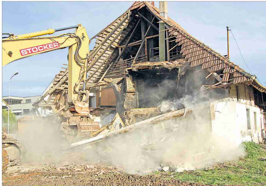
Abbruch Brunnerhaus: Wenn sich der Staubvorhang senkt, bleibt der Blick an russgeschwärzten Wrack-Teilen haften, die einst als Ganzes Obdach boten.