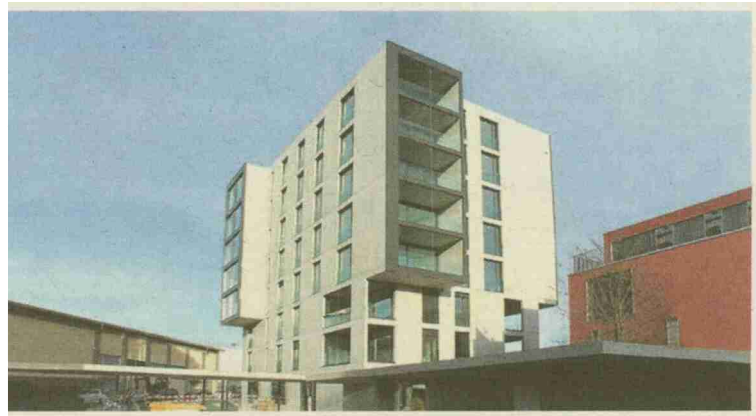
Eigentumswohnungen Schüsspark SEI, Biel

Themen-Nr.: 818.006 Abo-Nr.: 1088641 Seite: 21 Fläche: 58'412 mm 2