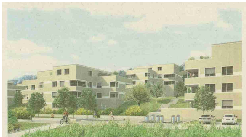
Eigentums- und Mietwohnungen Bellevuepark, Port