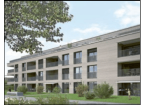
Das Projekt Tulpenweg in Täuffelen umfasst 20 Mietwohnungen mit 1.5 bis 4.5 Zimmern, für die bereits Mietverträge abgeschlossen werden konnten. Übergabe ist im Oktober 2018.

Dennoch seien die gesetzten Ziele wegen höherer Steuerrückstellungen und einem ausserordentlichen Sanierungsaufwand, der in den Halbjahresabschluss einfliesst, verfehlt worden. Das Unternehmen geht jedoch davon aus, dass die Gesamtjahreserwartung erreicht werden könne.