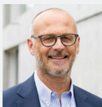
Roman Bolliger Swiss Circle AG

RMI veräussert. Die Liegenschaften waren 2007 übernommen und seither erfolgreich modernisiert und vermietet worden. Über ihre Anlagegruppen AFIAA Global und AFIAA Diversified indirect ermöglicht die Anlagestiftung Schweizer Pensionskassen direkte und indirekte Investments in ausländische Liegenschaften – bei Bedarf auch mit Währungsabsicherung. www.afiaa.com