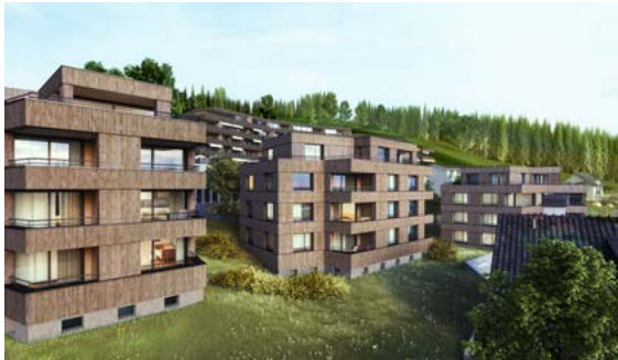
Unterägeri, Am Baumgarten maisons A bis C