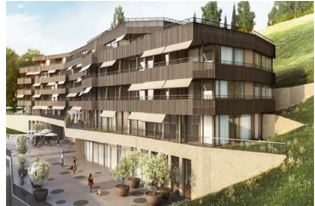
Unterägeri, Am Baumgarten maison G

Weiterführende Informationen finden Sie in unserer Projektübersicht 2019/2020 bonainvest.ch/immobilien