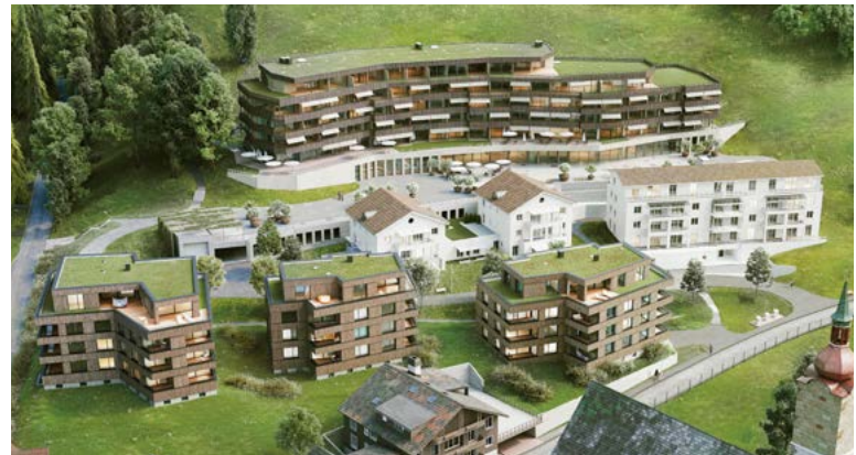
Unterägeri, Am Baumgarten maison G